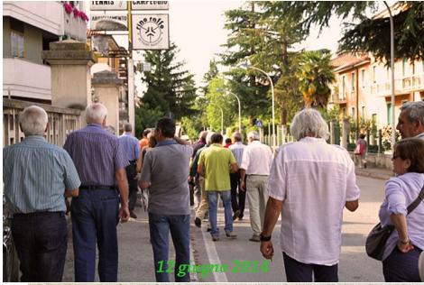
12 Giugno 2014